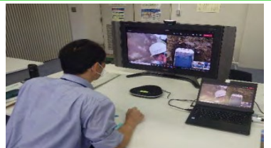
技術者が、カメラ映像を確認し、現場へ指示